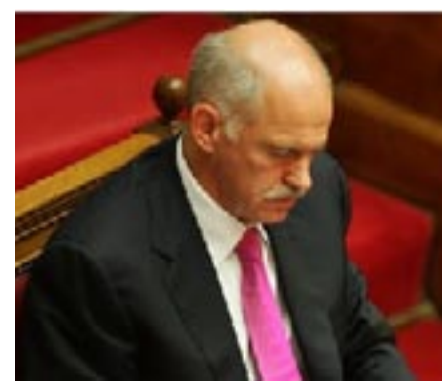
Πάει μέ τόν Έρντογάν στη διάσκεψη των ...Τούρκων πρεσβευτών (Ερζερούμ, 7-1-11) κι εκεί αναμένεται νά πλασάρουν «σχέδιο ειρήνης» για τό Αϊγαίο! Ό Θεός νά μάς φυλάξει...