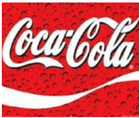
Της Oya Gur ως διευθύντριας επενδυτικών σχέσεων στην Coca-Cola 3E, μεταγραφή από την Coca-Cola Τουρκίας. Τί πρόβλημα έχετε; Όλοι δέν είμαστε παιδιά της Coca-Cola;