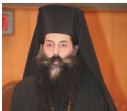
Ό Πειραιώς Σεραφεΐμ πού πέταξε στά μούτρα των Καμπούρακη-Οικονομία την αλήθεια για τις άθλιότητες του σιωνισμού (τραπεζικές, ναζιστικές, αποδομητικές κλπ)